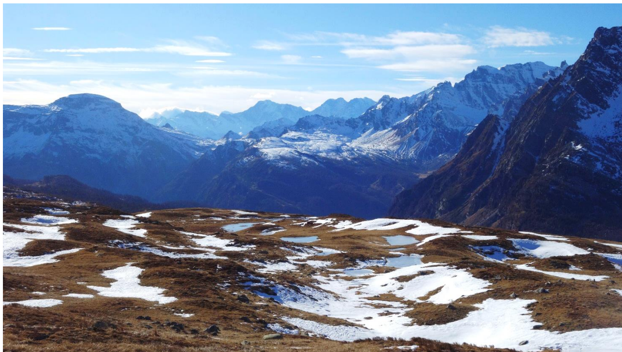
Il “Grande Est” del Devero

Il Comitato Tutela Devero continua il suo indefesso e indispensabile monitoraggio del territorio e delle contraddizioni normative insite nei singoli progetti. Le azioni di tutela comportano spese per analisi ambientali e legali. Potete contribuire anche voi sul sito www.comitatotuteladevero.org